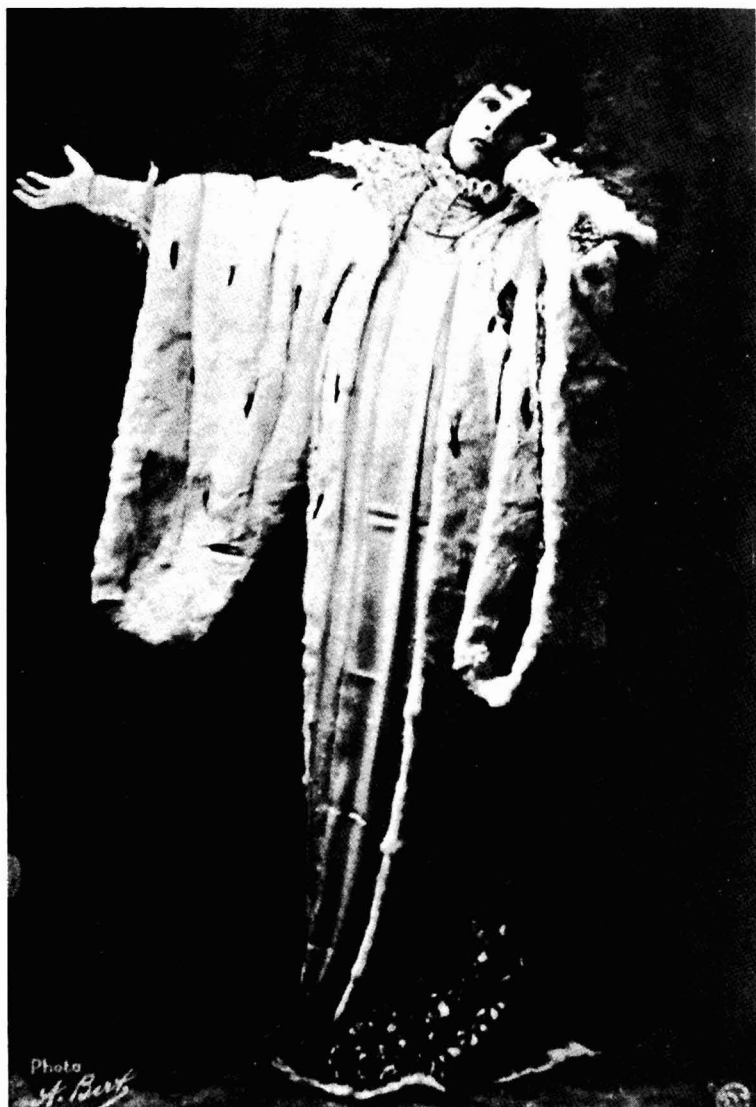
Sarah Bernhardt in een kostuum van Paul Poiret voor QUEEN ELIZABETH (1912)