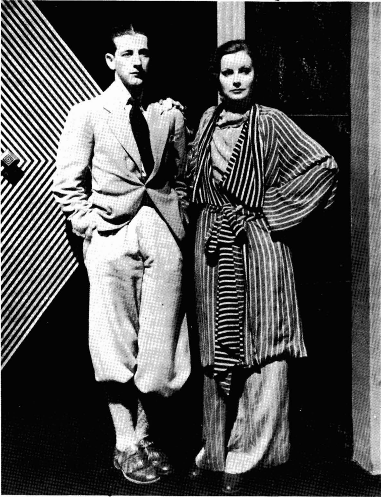
Adrian en Greta Garbo op de set voor THE SINGLE STANDARD (1929)