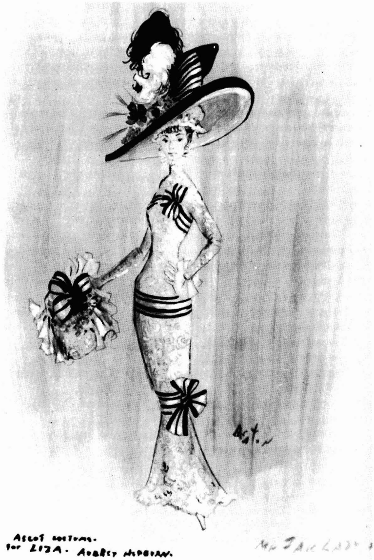
Schets van Cecil Beaton voor de Ascot-jurk in MY FAIR LADY (G. Cukor, 1964)