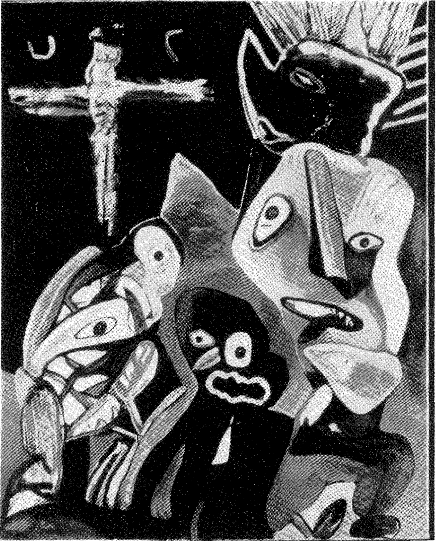
Lucebert, En zij wendden zich af van het Kruis , 1985, olieverf op doek, 145 x 115 cm.