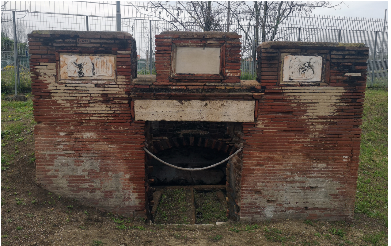
afb. 3 Grafmonument van Scribonia Attice. Het reliëf rechts geeft Scribonia Attice als voedvrouw weer. (ISIS 133; graftombe 100 in Ostia Antica).

verzamelde inscripties noemen 52 expliciet een taak of rol, waarvan arts ( medica , 3), voedster ( nutrix , 3), kapster ( ornatrix , 4) en voedvrouw ( obstetrix , 5) het vaakst voorkomen. 35 Hieronder zien we, naast de inscriptie voor Sabina, nog een inscriptie van een voedster: