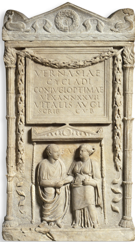
afb. 2 Urn met inscriptie en dextrarum iunctio reliëf (CIL 6, 8769).

manier voor libertae om af te rekenen met het stigma van onzedigheid. 15 Hoe zien we dit terug in onze bronnen?