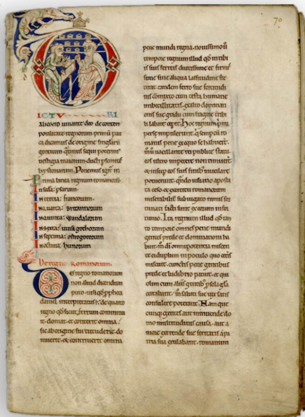
Sigebert van Gembloux, Chronica. Initiaal D van 'Dicturi' in de continuatio van de kroniek van Sigebert. Bovenaan links zie je Sigebert dicteren aan een kopiist. Bron: Avranches, Bibliothèque Municipale, ms. 159, fol. 70r. 12e eeuw

Toch was er weerstand tegen deze verordeningen. In Engeland en Normandië bleven gehuwde priesters en zelfs bisschoppen tot ver in de twaalfde eeuw voorkomen, waarbij dit niet ongewoon werd bevonden, noch verstopt werd voor de buitenwereld. 8 In dit artikel zal de focus liggen op het bisdom Luik, dat deel uitmaakte van het Heilig Roomse Rijk onder keizer Hendrik IV. Traditioneel wordt het bisdom afgebeeld als 'opstandig' vanwege een veronderstelde blinde keizersgezindheid. 9 Recent onderzoek heeft echter deze visie van het bisdom Luik als weerbarstig en verdeeld genuanceerd en de complexe situatie die achter politieke en religieuze interacties schuilt helder weergegeven. 10 Meer specifiek wordt gekeken naar de argumenten tegen het celibaat in de geschriften van Sigebert van Gemblours (1028-1112), die zich eerst anoniem en later openlijk uitsprak tegen het verplichte celibaat voor geestelijken. Als monnik van een prominente abdij gelegen in Luik zagen negentiende en twintigste eeuw-