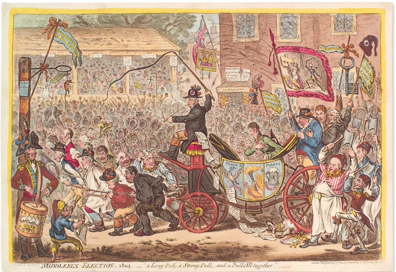
'Middlesex-election. 1804' door James Gillray, handgekleurde ets en aquatint, gepubliceerd door Hannah Humphrey, 1804.

echtgenotes van de staatslieden en diplomaten vervulden daarbij de rol van gastvrouw. Zij bepaalden wie tot de genodigden behoorden, en wie op welk moment aan elkaar werden voorgesteld. Netwerken en lobbyen noemen we dat tegenwoordig. Ik zou politiek willen definiëren als "de kunst van het mogelijke". Politiek gedefinieerd in de meest ruime zin, toegepast op historisch onderzoek, brengt dus ook vrouwen in beeld. En trouwens ook andere groepen die toen niet tot de top van de samenleving behoorden, zoals joden en katholieken.