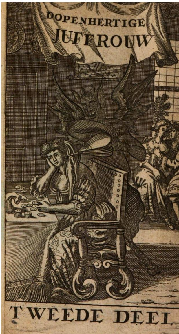
Een vrouw telt haar geld terwijl er een duivel listen en streken in haar oor spuit. Uit: Francois Vrouwaert, D'openhertige juffrouw, of d'ontdekte geveinsdheid . Tweede Deel (Leiden 1699) titelblad.