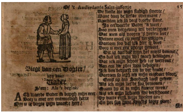
Anoniem, De nieuwe vermeerderde Haagse Joncker, of 't Amsterdamse Salet juffertje (Amsterdam 1717) p. 15.

als in de rest van Europa, heeft na Haks een uitgebreide navolging gevonden. 12