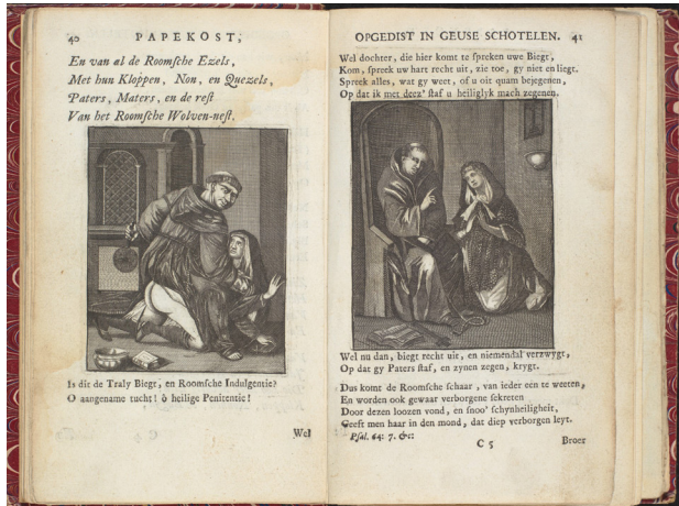
Satirische illustratie van pater 'Kornelis' die een non op haar blote achterwerk slaat met een zweep. Uit: Laurentius Steversloot, Papekost, opgedist in Geuse schotelen (Blokzijl 1720) p. 42.

Representaties van vrouwelijke seksualiteit in de Republiek tussen 1710 en 1740