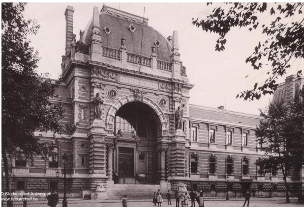
Gerechtsgebouw Antwerpen, 1892