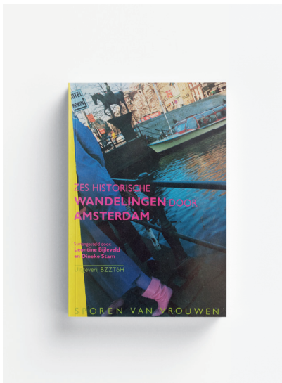
Sporen van Vrouwen. Zes historische wandelingen door Amsterdam , 1987.