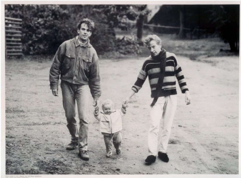
Poster uitgegeven door het Roze Aktiefrent (RAF) in 1992