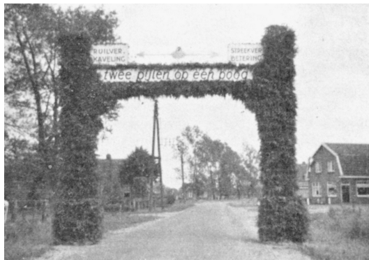
Triomfboog ter gelegenheid van de afsluiting van de streekverbetering en de ruilverkaveling in 'Spier-Wijster'.

esgronden plaatsgevonden, maar de aanwijzing tot streekverbetering gebeurde toch vooral omdat er sprake was van een ernstige landbouwkundige achterstand.