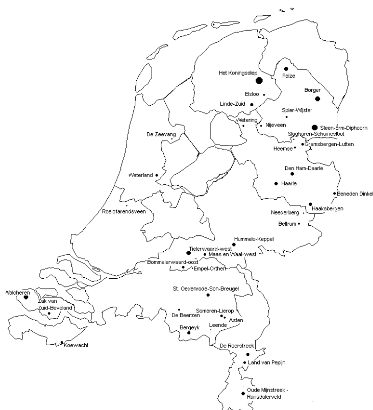
Kaart 4.1 Streekverbeteringen in selectiegroep, 1956-1970

De selectiegroep omvat 38 streekverbeteringen uit de periode 1956-1970.