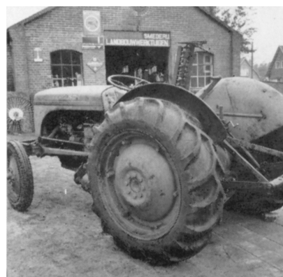
Mechanisering in streekverbeteringen.

De verbetering van de veestapel had vooral betrekking op de aankoop van fokmateriaal, maar die verbetering konden boeren ook bereiken door moderne voedingsmethoden toe te passen. In de streekverbetering 'Spier-Wijster' richtten de veehouders bijvoorbeeld een veevoederkern op die financieel ondersteund werd door het Provinciaal Veevoedselbureau voor Drenthe. Aan dit project namen 35 boeren deel. Doel was hen vertrouwd te maken met het