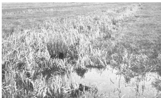
Bij ruilverkavelingen konden door verbetering van afwatering ook de weilanden worden verbeterd.

‘Someren-Lierop’. De herverkaveling speelde in Leende wel een belangrijke rol, maar er was geen sprake van een wettelijke ruilverkaveling. Op grond van de in 1954 aangenomen ruilverkavelingswet betekende een ruilverkaveling veel meer dan het simpelweg herverdelen van stukken grond. Een ruilverkaveling-nieuwe-stijl ging gepaard met een grondige revisie van de infrastructuur. Leende maakte daarop aanvankelijk geen kans en besloot daarom op vrijwillige basis te herverkavelen. Zo werd de oorspronkelijke verkaveling in 855 percelen gereduceerd naar 312. De gemiddelde perceelsgrootte nam daardoor toe van 40 naar 110 are. De ruilverkaveling was hier niet de aanleiding tot de streekverbetering, want de vrijwillige herverkaveling was het gevolg van de streekverbetering. Uiteraard heeft deze herverkaveling wel invloed gehad op de inhoud en vorm van de streekverbetering. 21 Een vrijwillige ruilverkaveling langs de Dommel (1.300 hectare) was in 1963 aanleiding om de streekverbetering ‘St. Oedenrode-Son-Breugel’ aan te vragen. Het streekverbeteringsgebied was veel groter dan het te verkavelen gebied, en de vrijwillige herverkaveling duurde zo lang dat de streekverbetering allang beëindigd was toen de verkaveling nog haar beslag moest krijgen. Uiteindelijk werd het als vrijwillig gestarte project opgenomen in de wettelijke ruilverkaveling van de gemeenten St.