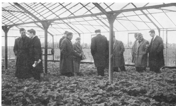
De streekverbeteringscommissie 'Bommelerwaard-oost' inspecteert een tuinbouwdemonstratiebedrijf, ca. 1960.

Ondervertegenwoordigd zijn wel de zeeleigebieden. Het relatief grote aandeel van zeeleigebieden in de streekverbeteringen kan enige verwondering wekken, aangezien men veronderstelde dat in deze gebieden de achterstandsproble-