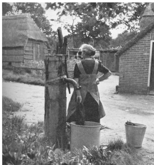
Wageningse sociologen wilden het traditionele platteland moderniseren.

De Wageningse sociologen schetsten in hun studies regelmatig het beeld van de gesloten dorpsgemeenschap, waar de lokale leiders (burgemeester, predikant, grote boeren) de normen in hun kleine kosmos bepaalden. De gemeenschap was sterk georiënteerd op oude waarden, vernieuwingen bekeek ze met argwaan. Daartegenover stond de moderne, veelal stedelijke, mens die vanuit een individueel zelfbewustzijn open stond voor verandering van zijn omgeving en die innoveren als een noodzaak voelde. In de overgangperiode van traditioneel naar modern stonden deze twee typen samenlevingen naast en soms tegenover elkaar. In dit boek zal de theorie van het modern-dynamische cultuurpatroon ook aangeduid worden als de (Wageningse) moderniseringsthese.