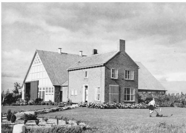
Modern agrarisch ondernemen in de IJsselmeerpolders in de jaren vijftig.

Wat er wellicht voor de buitenwereld er uit zag als een onaantastbare theorie over modernisering, is dat voor de meeste Wageningers zelf nooit geweest. In de loop van de jaren zestig kwam die twijfel over de moderniseringstheorie sterker naar voren dan eerder. Daarvoor zijn verschillende factoren aan te wijzen. De proefschriften van Van den Ban, Benvenuti en Bergsma bleken de theorie van het modern-dynamische cultuurpatroon minder onomstotelijk te kunnen funderen dan gehoopt. Bovendien raakte de moderniseringstheorie in de praktijk overleefd. Nederland kende in de jaren zestig minder achtergebleven agrarische gebieden dan in de jaren vijftig en de modernisering leek de Wageningse voorspellingen zelfs in te halen. Bovendien kwam ook steeds meer de rol van de socioloog als sociaal-ingenieur ter discussie te staan.