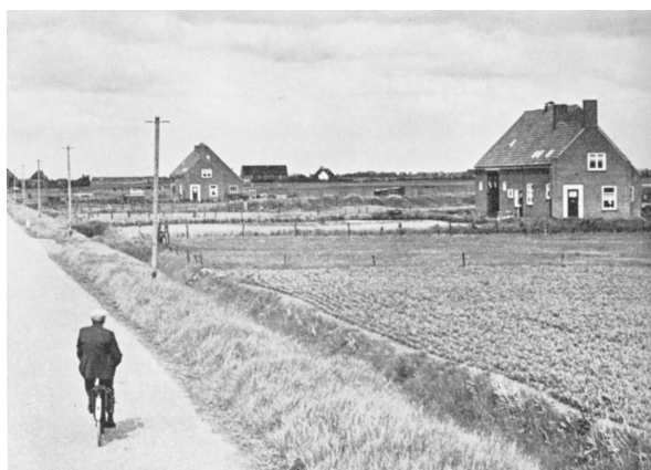
Modernisering betekende ook verplaatsing van boerderijen naar het land en in de buurt van een verharde weg.

Benvenuti stelde een verzamelhypothese centraal in zijn onderzoek. Wat opviel was zijn benadrukking van het individualisme van de moderne boer. Weliswaar had ook Hofstee meermaals benadrukt dat een moderne boer zich minder afhankelijk van zijn omgeving opstelde dan een traditionele boer, maar hij was daar-