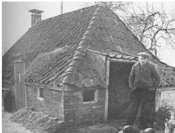
Het cultuurcomplex van de traditionele boer en landarbeider werd gekenmerkt door gezinsbedrijf en armoede volgens de Wageningse sociologen.

Deze gaf een goed inzicht in de wijze waarop de Wageningers begin jaren vijftig de boerenwereld verdeelden in traditioneel en modern. Daarom wordt