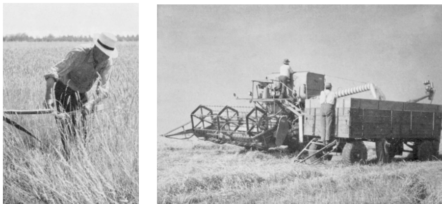
Streekverbetering ‘Oude Mijnstreek-Ransdalerveld’: modernisering van de bedrijfsstijl achtte het ministerie van Landbouw noodzakelijk.