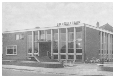
Modernisering vereiste dat boeren minder wantrouwend tegenover banklening zouden staan.

Hofstees zesde stelling behandelde de invloed van standverschillen. Die leidde ertoe dat elke boerenstand zijn eigen sociale kring creëerde. De voorlichting neigde er echter toe alle boeren in een streek over één kam te scheren, waardoor ze vaak slechts de belangstelling van de grote boeren trok. Het was van belang de verschillende groepen afzonderlijk te benaderen, bijvoorbeeld via praatavonden. Over het algemeen, zo bleek ook uit latere