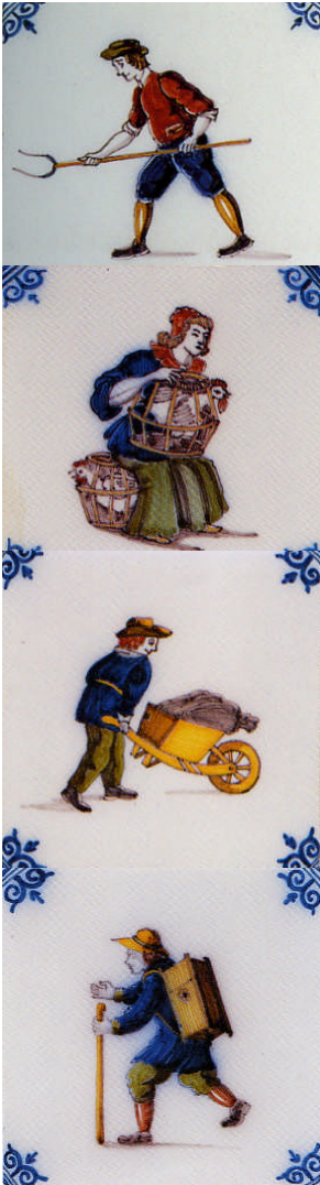
Het boerenbedrijf in de negentiende eeuw.

De markeverdeling, zo was de boodschap, zou de samenstellende delen van het land sterker maken en daarmee ook de staat. Vanwege dat belang en 'om den bodem van Nederland tot de hoogstmogelijkste productie op te voeren', verzochten de rekwestranten de koning dus om 'eene wet op de verdeling van de markegenootschappen en soortgelijke van ouds bij sommige corporatiën in gemeenschap bezeten zijnde gronden' aan de volksvertegenwoordiging te willen voordragen.