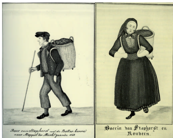
Boer van Staphorst met de Botter-benne naar Meppel ter Markt gaande 1848