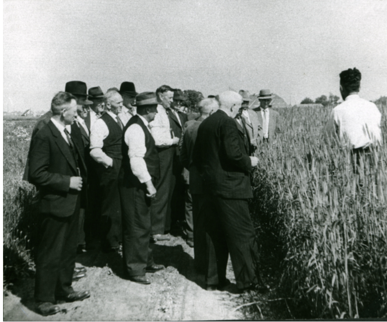
Voorlichters in het Groningerland op werkbezoek

ouderde productietechnieken gangbaar waren en waar de bevolking hoofdzakelijk bestond uit kleine boeren. Hier moesten niet de bezoekers, maar de inwoners zelf ertoe overgehaald worden de moderne wereld binnen te stappen. Na evaluatie in 1955 werd besloten om volgens de Kerhovense methode voort te gaan. Dus niet een modeldorp gebruiken om andere boeren te overtuigen, maar een daadwerkelijke toepassing van het sociaal-ingenieurschap door boeren te veranderen.