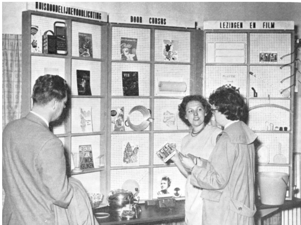
Huishoudelijke voorlichting was een belangrijk onderdeel van de streekverbeteringen

zeker. In de streekverbetering 'St. Oedenrode-Son-Breugel' startten in de jaren 1964-1966 32 boerinnen met een kasboek, maar slechts 20 hielden dat een jaar lang vol. 44 In 'Sleen-Erm-Diphoom' bleek het idee van de kasboekjes evenmin aan te slaan. Na afloop van de streekverbetering hield nog geen 5 procent van de vrouwen een boekhouding van het huishouden bij. 45 In 'Koewacht' was het succes niet veel groter. De scheiding van huishoud- en bedrijfsgeld was in belangrijke mate een mentaliteitskwesitie. Zonder huishoudboekje kon die scheiding echter ook worden doorgevoerd. Op de meeste cursussen leerden de huishoudconsulenten de boerinnen zo concreet mogelijk hoe zij het huishoudgeld efficiënt konden verdelen over de verschillende uitgavenposten. Een stel potjes met etiketten was dan net zo effectief als een kasboek.