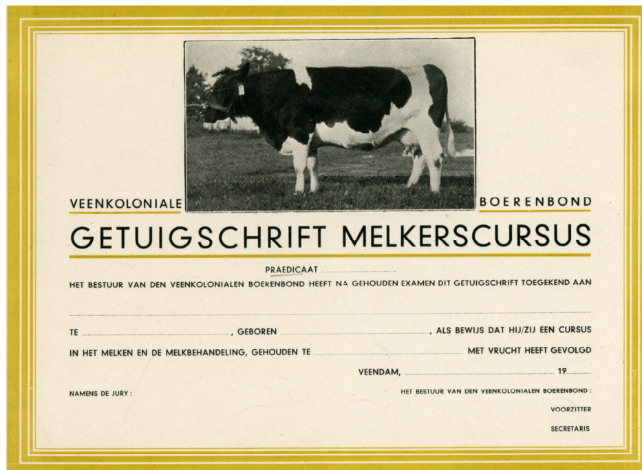
Net als andere boerenbonden organiseerden de Veenkoloniale Boerenbond voor haar leden allerlei cursussen, (Collectie Veenkoloniaal Museum Veendam)

bieden waren al voorlopers van landbouwverenigingen, met vaak een wat beperktere doelstelling, maar bestuurlijk wel bevolkt door boeren, zoals de Drentse marken en de polder- en waterschappen. Dit soort organisaties is van oudsher zeer kleinschalig. Zo waren er in Friesland, in 1952, in het werkgebied van het huidige Wetterskip Fryslân, 255 geregementeerde waterschappen actief (inclusief 12 veenpolders), en daarnaast nog bijna duizend particuliere eenheden, en in 1960 nog ongeveer dezelfde aantallen. 12 Het gaat dan dus om meerdere duizenden