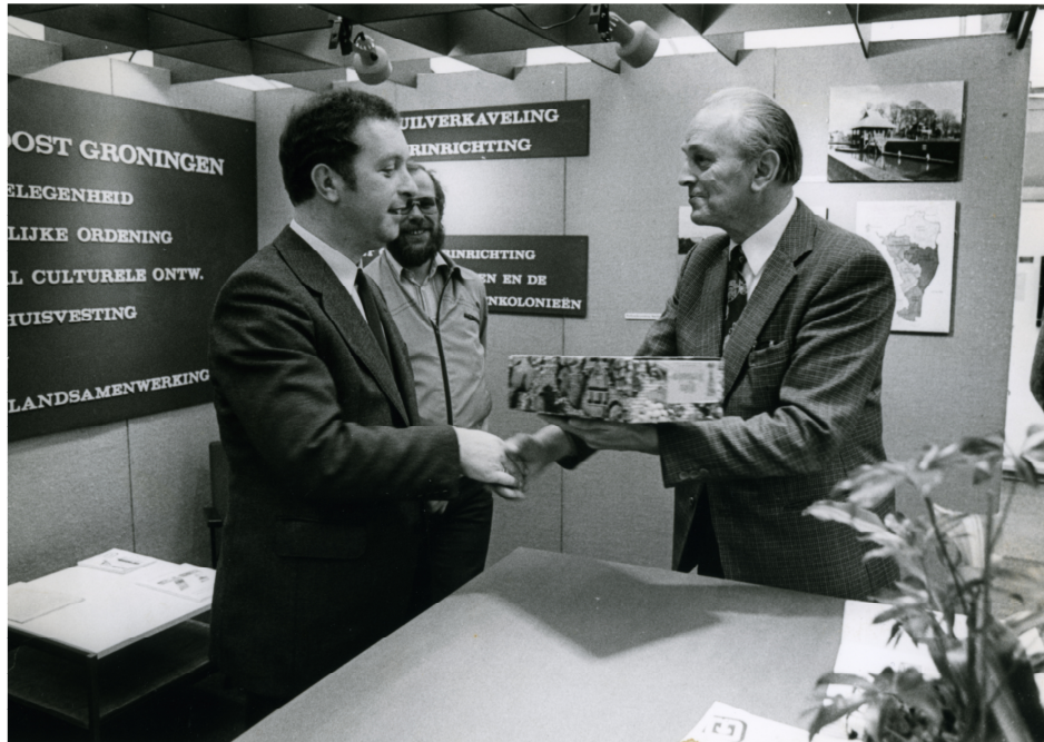
Na de Tweede Wereldoorlog vonden er een groot aantal ruilverkavelingen plaats. Oost-Groninger boeren werden via voorlichting voorbereid op de rationalisaties van de landbouw

In de tijd na de Tweede Wereldoorlog is door de rationalisatie van de landbouw de situatie sterk veranderd. De boerenbedrijven werden langzaam aan gezinsbedrijven, met in feite maar één werkende, de boer zelf. Met het groter worden van de bedrijven werd ook de fysieke afstand tot boeren/buren groter. Mechanisatie zorgde ervoor dat veel werkzaamheden zonder hulp van buiten uitgevoerd konden worden. 26 Daar kwam bij dat door de afname van het aantal landbouwbedrijven het aantal boeren in de directe omgeving daalde en het aantal burgers toenam.