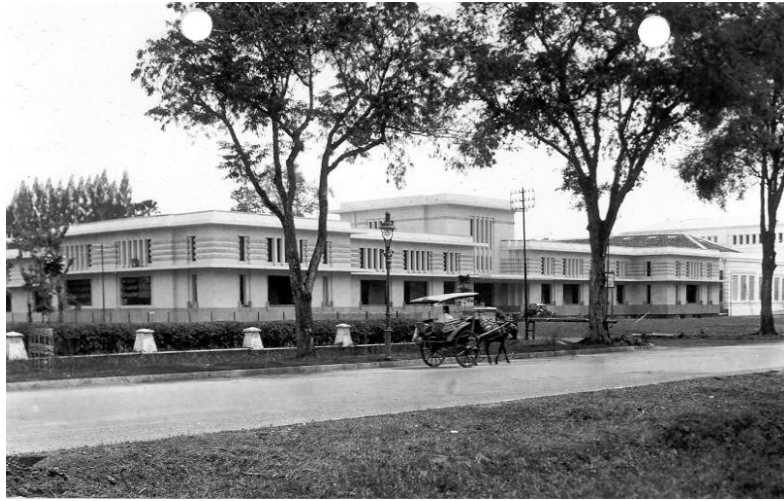
Rechtshogeschool te Batavia (december 1929)