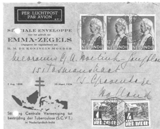
'Luchtpost' (1934) uit Batavia.