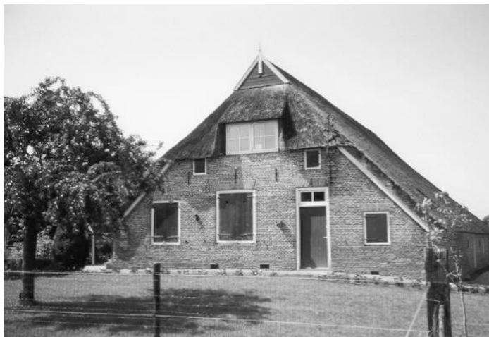
De voormalige boerderij 'Hoetink' of 'Hoetinkshoeve' aan de Oudhuizerstraat (thans 23) in Voorst op de rand van Klarenbeek.