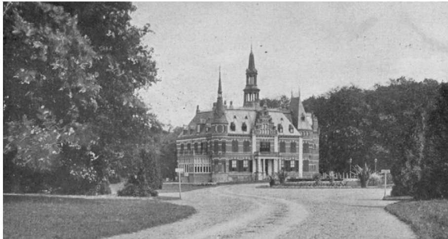
Landgoederen, ooit een stedelijke enclave in het landelijk gebied, vormen nu een essentieel onderdeel van de groene ruimte

decennia later vond, dat dit soort defensieve opvattingen uit de tijd was, was de depressie voorbij en waren mobiliteit, industrialisatie en economische groei zodanig toegenomen dat er, naar buitenlands voorbeeld, paleisachtige stations konden worden neergezet.