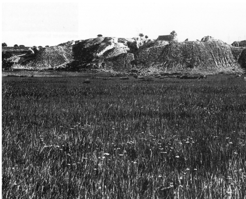
Deze foto toont Troje gezien vanuit de vlakte ten tijde van Schliemann.

I always hate nostalgia, living in the past ... I'm not looking for arcadia, 'cause it's never coming back (Mick Jagger, 'Too far gone', Goddess in the doorway, 2002)