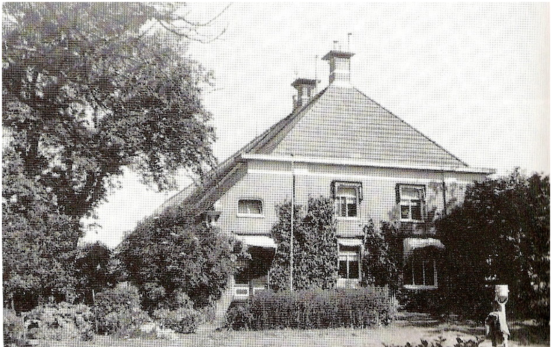
Boerderij Nieuw Midhuizen in de Westpolder te Vierhuizen. Ir. A.J. Louwes Lelystad