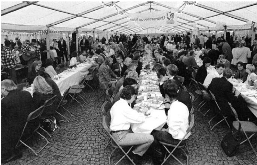
Het Nationale Ontbijt van 19 september 1998 op De Dam in Amsterdam

Op zaterdagmorgen 19 september 1998 ging de voorlichtingscampagne Ondernemers van Nature officieel van start. Die ochtend werden op de centrale pleinen van vijftien steden lange ontbijttafels gedekt met daarop producten van het Nederlandse platteland. Iedereen die dat wilde, kon aanschuiven en een hapje mee-eten tijdens dit zogenoemde Nationale Ontbijt. Leden van het Nederlands Agrarisch Jongeren Kontakt leidden alles in goede banen. Het festijn trok over het hele land verspreid in totaal 15.000 belangstellenden.