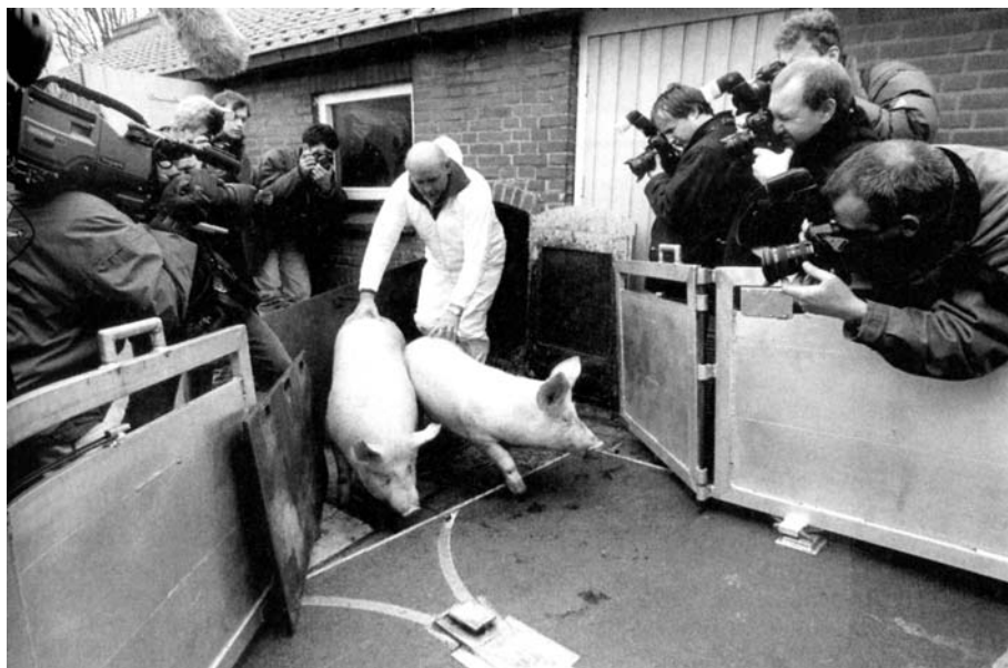
Fotografen en cameramannen brengen op 14 februari 1997 in Venhorst één van de eerste preventieve ruimingten ter bestrijding van de varkenspest in beeld

zetmarkt. Vanaf 1990 verschenen in de Duitse media echter berichten met als strekking dat de in Nederlandse kassen gekweekte tomaten waterig waren en geen smaak hadden. De Nederlandse kastomaten kregen de naam Wasserbomben te zijn. Deze negatieve berichtgeving leidde tot het inzakken van de Nederlandse tomatenexport naar Duitsland. Voorlopig prefereerden de Duitsers zongerijpte tomaten uit Zuid-Europa. In Nederland zorgde de affaire voor een hernieuwde dynamiek in de tomatenteelt en overige glastuinbouw. Veredelaars ontwikkelden nieuwe tomatenrassen, waarbij behalve op hoge productie en goede houdbaarheid werd geselecteerd op zaken zoals smaak, kleur en textuur. Door op deze manier rekening te houden met de veranderde wensen van de consument, lukte het de Nederlandse glastuinbouw het verloren aandeel op de Duitse markt terug te winnen. 124