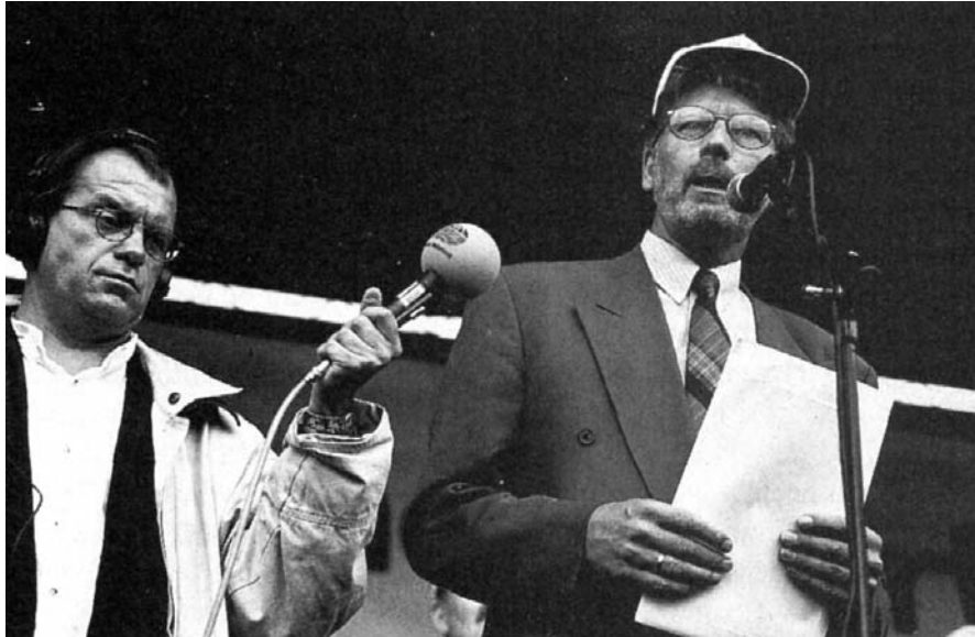
LTO-voorzitter Gerard Doornbos voert het woord tijdens een demonstratie tegen het mestbeleid op 15 september 1995 in Den Haag.

zou een geleidelijke verdere aanscherping volgen, tot een uiteindelijk toegestaan fosfaatverlies van 20 kilo per hectare per jaar. 202