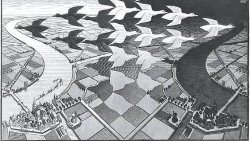
Afbeelding 4. M.C. Escher. Dag en Nacht . Houtsnede in zwart en grijs, 67,6 cm x 39,1 cm. Leeuwarden: Fries Museum, 1938.

zaal. In dit schilderij zien we dat de, in tegengestelde richting vliegende, zwarte en witte ganzen vervormen tot akkers in een geometrisch landschap. Eenzelfde afdruk van deze prent werd in 2012 nog voor 10.000 euro verkocht door veilinghuis Christie's. 5