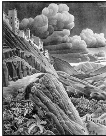
Afbeelding 1. M.C. Escher. Castrovalva . Litho in zwart en grijs, 42,1 cm x 53 cm. Leeuwarden: Fries Museum, 1930.