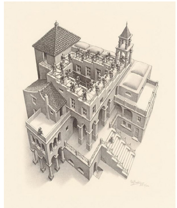
Afbeelding 5. M.C. Escher. Klimmen en Dalen . Litho, 28,5 cm x 35,5 cm. Leeuwarden: Fries Museum, 1960.

In de laatste zaal van de tentoonstelling vinden we geen Italiaanse landschappen meer, maar wel het latere werk van Escher. In zijn latere werken begon Escher met het maken van vlakvullingen. Deze vlakvullingen werden door hem ook wel zijn 'tovertuin' genoemd. Een terugkerend thema in deze stukken is de 'oneindigheid'. Door middel van herhalingen probeerde hij deze oneindigheid grafisch weer te geven. In deze zaal vinden we ook zijn bekende werk Klimmen en Dalen (zie afb. 5). Hierin zien we een oude liefde van Escher terug, de architectuur. In deze stukken staat het perspectief centraal. Wanneer de toeschouwer vanuit verschillende perspectieven het gebouw