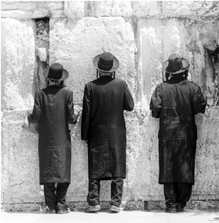
Afbeelding 3. De Klaagmuur of Westelijke Muur

christenen, voelden zich bedreigd en zonden een protest naar Istanboel, de zetel van het Ottomaanse Rijk. Intussen lieten Engelsen, Duitsers, Russen en Fransen zich niet onbetuigd in het stichten van ziekenhuizen en scholen – iedereen wilde een stempel op Jeruzalem drukken, een reden voor de Britten om uiteindelijk hun interesse voor Jeruzalem door te zetten, de stad te veroveren en in 1922 op gezag van de Volkenbond het Mandaatbestuur te accepteren. Jeruzalem werd getekend door verdeeldheid en conflict, ook binnen de Zionistische beweging waarvan de moord op Jacob Israël de Haan op 30 juni 1924 een getuigenis is. 12 Ondanks spanning en opstanden ging de immigratie door, versterkt door de ontwikkelingen in nazi-Duitsland en de daaropvolgende Tweede Wereldoorlog. Jeruzalem werd in toenemende mate de spil in de strijd tussen het behoud van Brits bestuur en de nationale verlangens aan zowel Joods-Zionistische als Arabisch-Palestijnse kant. 13 De onafhankelijkheid van Israël werd op 14 mei 1948 uitgeroepen in Tel-Aviv,