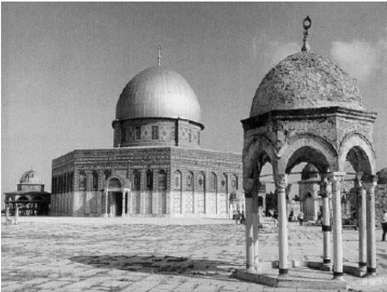
Afbeelding 2. De Rotskoepel

Grote (272-337) werd begonnen met de bouw van kerken. Het monastieke leven nam bezit van de stad en al spoedig was Jeruzalem het centrum van een actieve, christelijke gemeenschap. Even nog gloorde er hoop, toen de Romeinse keizer Julianus (331-363) een poging deed om de christelijke staatsgodsdienst terug te dringen en in die context Joden probeerde over te halen terug te keren en de Tempel te herbouwen. Hij wenste de Tempel en de offerdienst volgens de joodse traditie te herstellen. Het is onduidelijk of er werkelijk veel instemming te vinden was van de kant van de Joden om het plan van Julianus te realiseren. Christelijke auteurs berichtten dat in 363 inderdaad met de voorbereidingen tot de Tempelbouw werd begonnen, maar dat door een aardbeving en branden de bouwactiviteiten werden gestaakt. Zij voerden het mislukken van het plan en de dood van de keizer in datzelfde jaar terug op een goddelijk ingrijpen, dat de triomf van het christendom zou bevestigen. Acute hoop vlamde opnieuw op toen in het jaar 614 de Perzen richting Jeruzalem marcheerden en een voorlopig einde maakten aan de Byzantijns-christelijke macht. De stad werd ter verdediging aan Joodse in- en omwonenden overgelaten, maar in 628 keerde het Byzantijnse gezag terug onder keizer Heraclius die bloedig wraak nam. Niettemin waren de dagen van Byzantijnse aanwezigheid geteld door de snelle opkomst van de