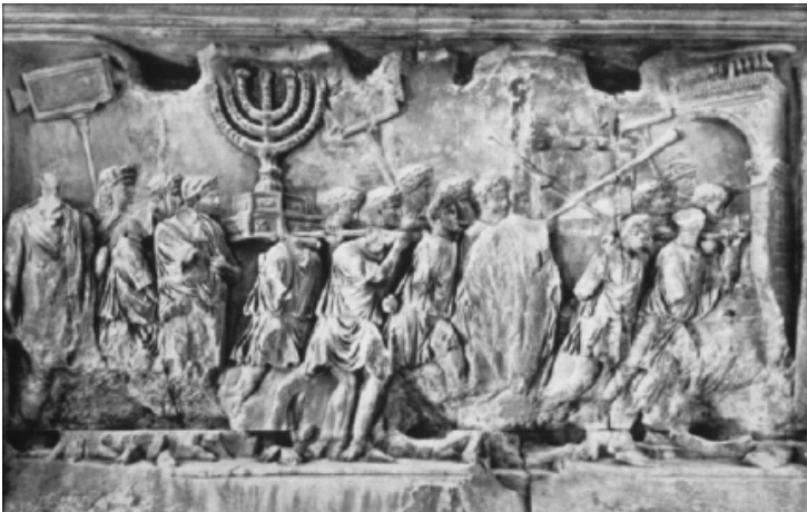
Afbeelding 1. Triomfboog van Titus: processie van Judeeërs in Rome met Tempelbuit.