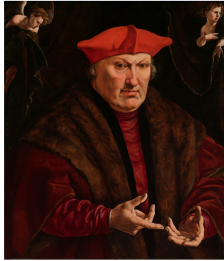
Afbeelding 1. Jan Cornelisz. Vermeyen, Portret van kardinaal Everard de la Marck, olie op paneel, ca. 1528. Amsterdam, Rijksmuseum.

De grootte en kostbaarheid van het grafmonument in de Sint-Lambertuskathedraal lijken erop te wijzen dat het meer was dan simpelweg een laatste rustplaats. Waarom had de kardinaal dit monument al in 1527 laten plaatsen en waarom verwees het zo nadrukkelijk naar hemzelf, via diverse inscripties en een levensgroot portret ten voeten uit? Lijkt het daardoor niet meer een monument van ijdelheid dan een grafmonument? Hoe reageerden tijdgenoten op deze manifestatie van pracht en praal ten bate van de kardinaals eigen nagedachtenis? Of is het praalgraf juist een herinneringsteken van vergankelijkheid, dat beschouwers confronteerde met het feit dat ook belangrijke kerkleiders als een kardinaal niet ontkomen aan de dood?