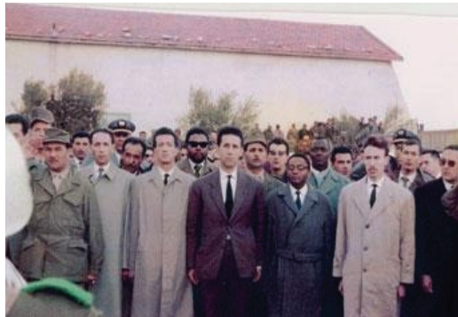
Afb. 3 Progressieve leiders bijeen op een boerderij bij Berkane, Noord-Oost Marokko. 15

Diverse leiders die in eigen land de strijd willen aanbinden met de koloniale bezettingsmacht, maken hun opwachting bij Abdelkrim in Caïro. De Zuid-Amerikaanse leiders Fidel Castro en Che Guevara bezoeken hem, en leren van de oude meester de guerrillatactieken en militaire strategieën die destijds in de Rif zo succesvol waren. Ho Tchi Minh in Zuid-Oost Azië correspondeert met Abdelkrim, en past in de strijd tegen de Fransen eveneens de guerrillatactiek succesvol toe. De grote voorvechter van onafhankelijkheid van Guinee-Bissau, Amilcar Cabral, en de Angolese leider Augustinho