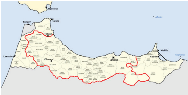
Afbeelding 2. Het gebied binnen de rode lijn is de Riffijnse Republiek zoals uitgeroepen door Abdelkrim in 1923, de witte delen daarbuiten zijn Spaans gebied, het overige is Frans Marokko. Chauen is Chefchaouen.

De veldslag van die zomer in 1921 wordt nog altijd herdacht als de Slag van Anoual, het is de grote overwinning die ook vandaag de dag nog in het geheugen van iedere Riffijn staat gegrift en waar ieder kind mee opgroeit. Na deze overwinning weet Abdelkrim de stammen te verenigen, organiseert hij zijn leger en trekt hij ten strijde voor de onafhankelijkheid van de Rif. In 1923 is het zover dat hij de Riffijnse Republiek uitroept: een eigen staat, met Abdelkrim als president, met een vlag, een munt (al wordt die nooit echt ingevoerd) en een leger. In 1924 worden de Spanjaarden na een bloedige strijd gedwongen het historische stadje Chefchaouen te ontruimen, waarna Abdelkrim er zijn hoofdkwartier vestigt. 5 De Riffijnen trekken blootshoofds en barvoets de voor hen heilige stad Chefchaouen binnen en zingen daar voor het eerst hun nieuwe volkslied. 6 Het is de apotheose van de bevrijdingsstrijd, Abdelkrim is op het hoogtepunt van zijn macht.