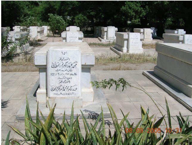
Afbeelding 4. Het graf van Abdelkrim al-Khattabi op de militaire begraafplaats in Caïro. Ik bezocht dit graf in 2005 in gezelschap van een van Abdelkrims zonen, Saïd. Die is in 2007 overleden.

niet van de toekomst. Dat betekent dat de manier van geschiedschrijving, het taalgebruik, het perspectief, de toon, mede bepalend is voor hoe we naar het heden kijken, en naar de toekomst. Dus is herschrijven van de episode van Abdelkrim en zijn betekenis ook in het belang van verbetering van de verstandhouding en het onderlinge begrip tussen Europeanen en Riffijnen, tussen kolonisators en een gekoloniseerd volk. Zolang Europa niet in de spiegel durft te kijken en weigert de eigen koloniale geschiedenis te evalueren, is er geen eerlijke verstandhouding met – in dit geval – Riffijnen mogelijk.