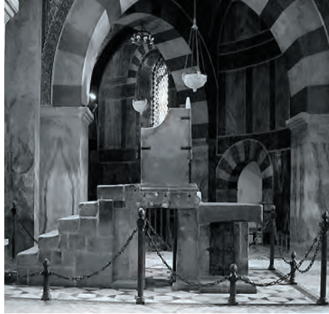
In de dom van Aken.

passeren waarop Karel, wellicht, een droom gehad heeft: de droom van een paleis-en-kerk, een manifestatie van macht zoals geen van zijn Frankische voorouders zich nog had durven dromen.