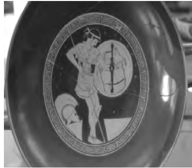
Afbeelding van een Griekse hopliet.

irrationeels als een voorspelling. Er moest iets belangrijkers zijn geweest, en men wist ook wel wat: Leonidas zou zijn gestorven voor de vrijheid van Griekenland. Deze moderne mythe is te verdedigen met een beroep op Herodotos, die meende dat de Perzen werden geregeerd door een almachtige koning terwijl de Grieken de wet beschouwden als hun heerser. Maar dat wil niet zeggen dat Leonidas soortgelijke gedachten heeft gehad: het is immers weinig aannemelijk dat de Spartaanse koning zich liet inspireren door pas na zijn dood te Athene geformuleerde theorieën over de spanning tussen koningschap en rechtsstaat.