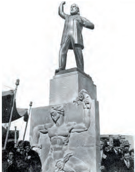
Onthulling van het standbeeld van Domela Nieuwenhuis op het Nassaplein.

Frankrijk of de Verenigde Staten, niet aan meerdere biografieën over dezelfde persoon gewend is. Over deze afwijking zou ik wel eens een boeiend artikel willen lezen, maar dit ter zijde. Wie naar het vernieuwende in deze studie wil peilen, moet nog wat geduld hebben. De biografie zal eind 2011 af zijn, maar wie er naar uitkijkt, kan er op rekenen dat Domela vanuit nieuwe gezichtspunten bestudeerd zal worden, zoals die van het charisma, van het romantisch revolutionaire engagement, van de orale cultuur en van de internationale context. Valt er meer te hopen dan dat het de lezer zal boeien?