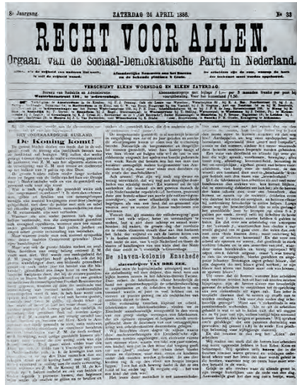
Recht voor allen , het blad van de Sociaal Democratische Bond.