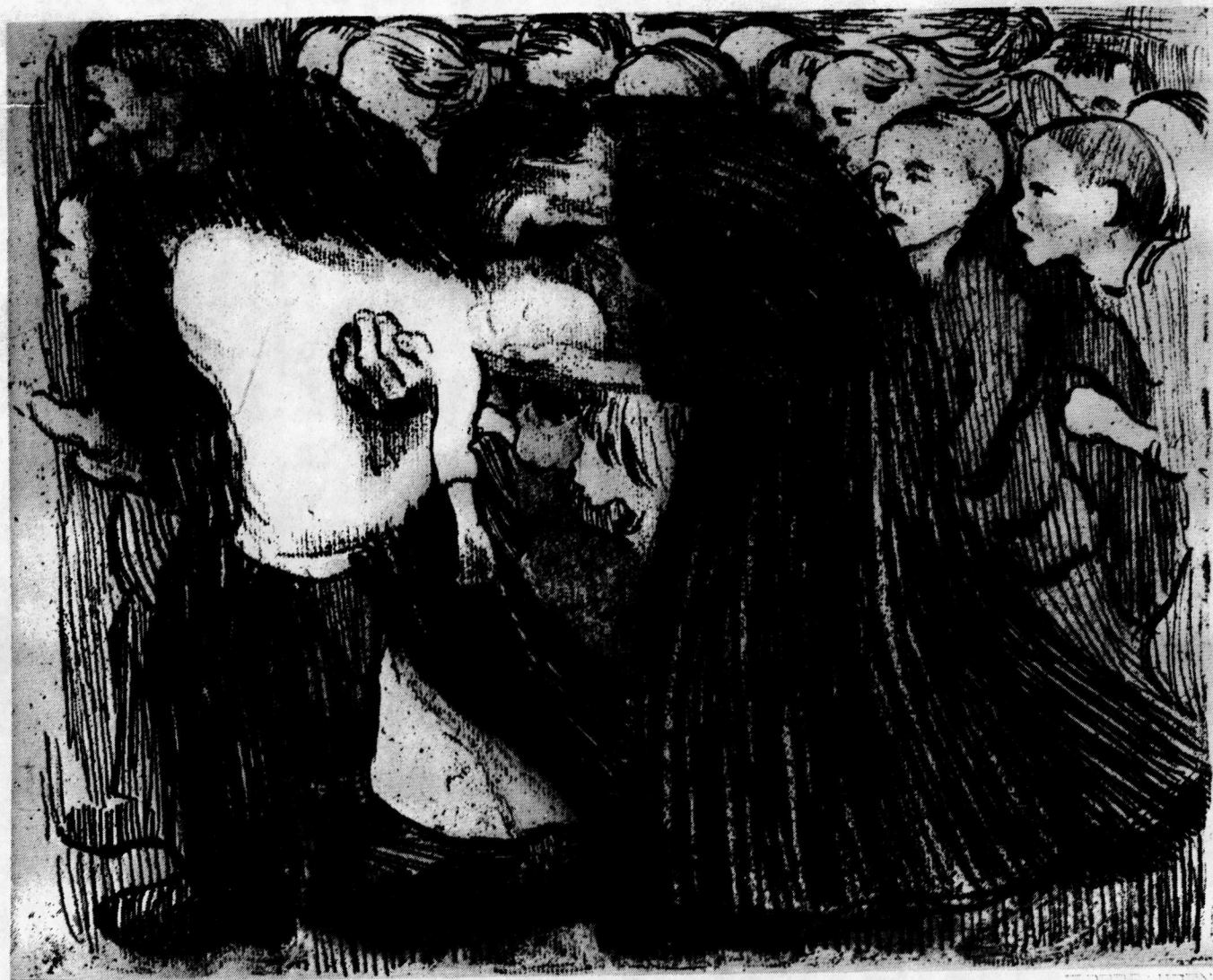
AUS DER KOLLWITZ-MAPPE DES KUNSTWARTS