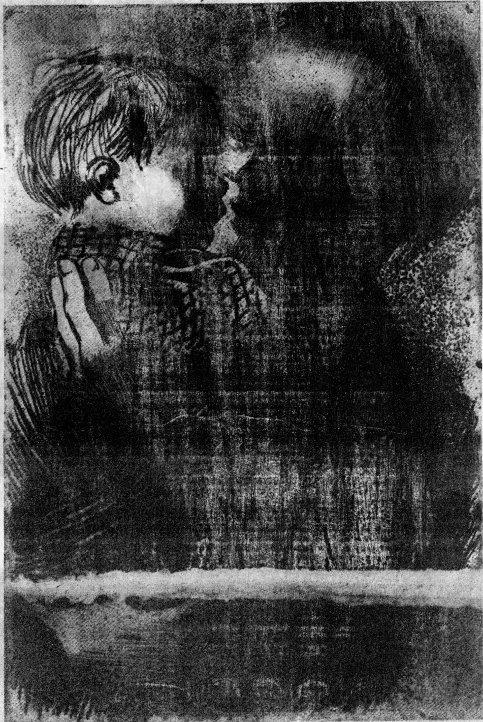
AUS DER KOLLWITZ-MAPPE DES KUNSTWARTS