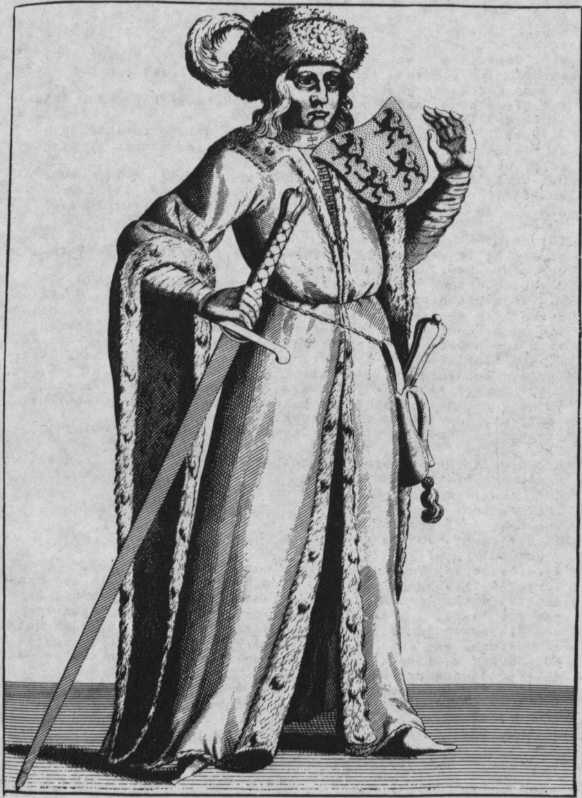
WILLEM de III.