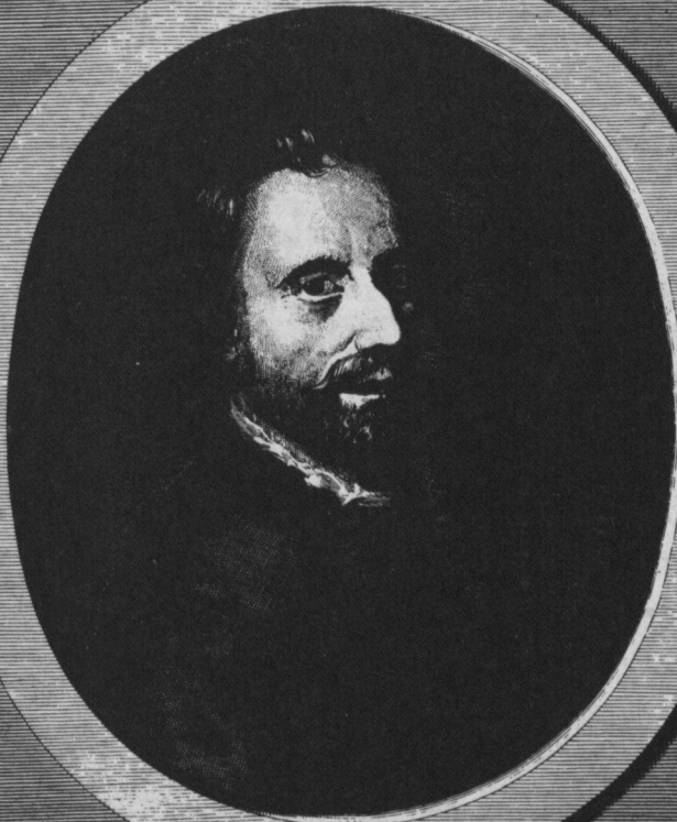
Heer GERARD van VELSEN, Ridder Heere van Velsen, Noortwyk, Kronenborg, &c. geheime Raad van FLORIS DE V. Graaf van Holland.