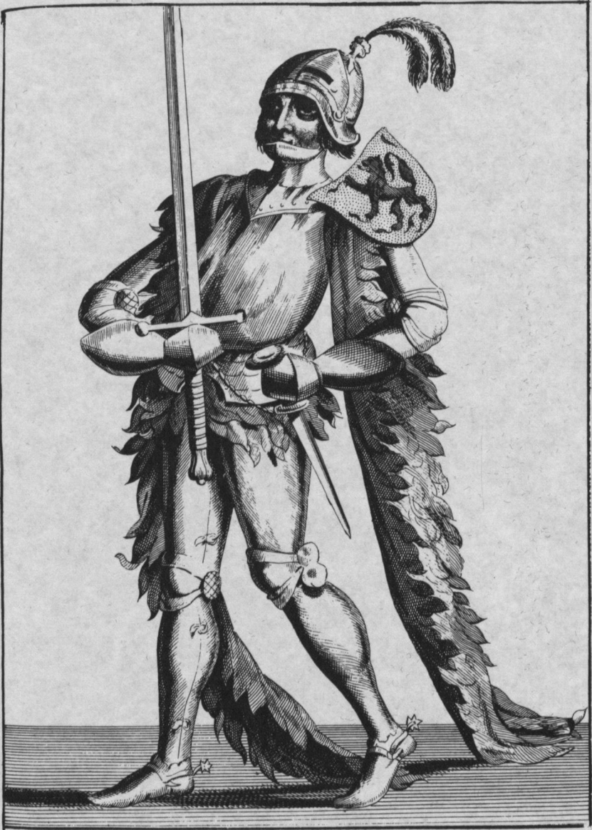
FLORIS de V.