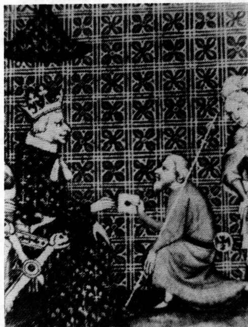
Bode met officiële brief (Miniatuur uit 'Grandes Chroniques de France', Bibliothèque Nationale Paris).

Anders is het met de correspondentie afkomstig van overheidscolleges, bestemd voor andere overheidscolleges of overheidspersonen. In de hier bedoelde brieven waren mededelingen opgenomen omtrent gebeurtenissen, meningen, besluiten en toestanden, die verband hielden met de uitoefening van overheidsfuncties of met zaken die voor de ingezetenen of bepaalde groepen van hen van belang waren. Deze mededelingen speelden een rol in het bestuur van stad en land en werden geheel of ten dele overgenomen in de mondelinge nieuwsvoorziening en berichtgeving aan de bevolking, of dienden ter verdere schriftelijke nieuwsvoorziening van anderen, zoals uit de stedelijke rekeningen duidelijk en uitdrukkelijk blijkt. Daarom vervult deze correspondentie een functie in de publiciteit zoals de middeleeuwen die kenden. Van deze publiciteitscategorie zijn eveneens gemakkelijk Gelderse voorbeelden aan te wijzen, namelijk de omvangrijke brievencollecties van de stedelijke Raden van Zutphen en Arnhem, die zich