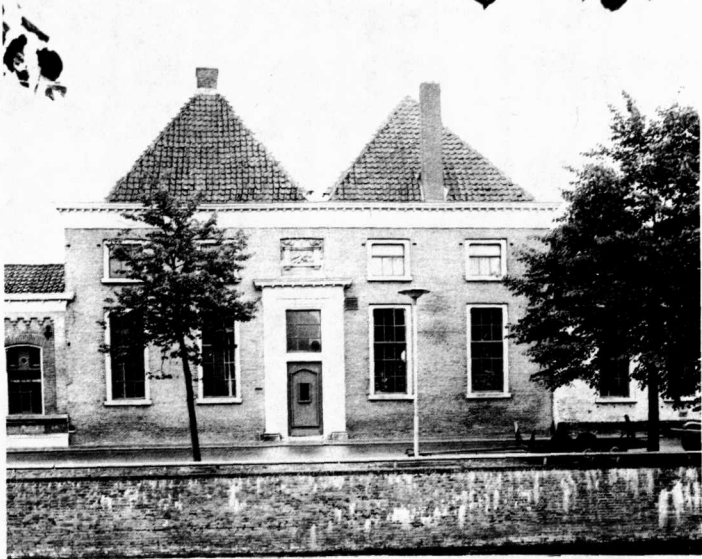
Huisvesting van de IJsselacademie in het Pesthuis van Kampen.

De werkgroep negentiende-eeuwse kerkgeschiedenis kan als voorbeeld dienen voor de werkwijze van de werkgroepen. Deze groep komt eens in de zes weken bijeen. De punten die besproken worden zijn dan onder andere artikelen die zij als 'huiswerk' hebben bestudeerd, een mondeling verslag van iemand die een relevant boek of artikel heeft gelezen of mededelingen van mensen die bezig zijn met scripties/artikelen. Leden van de werkgroep zijn een docent van de Theologische Hogeschool van de gereformeerde kerken en de archivaris van de gereformeerde kerken; men zou hen de deskundigen kunnen noemen. Hierdoor kan tijdens de bijeenkomsten directe uitwisseling van informatie plaatsvinden over literatuur en eventuele belangrijke en onbelangrijke archieven. De bijeenkomsten worden in verslagen vastgelegd en aan de deelnemers toegestuurd. Aan de werkgroep nemen verder deel enige studenten van de beide Theologische Hogescholen in Kampen en een aantal onderwijzers die bezig zijn met een