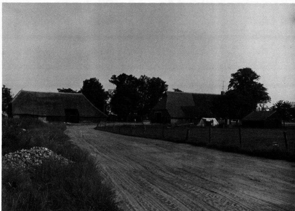
Dorpsgezicht Ten Arlo.

Om een aantal redenen hebben we als onderzoeksgebied de buurtschappen Linde en Ten Arlo gekozen. Om het dagelijks leven van mensen zoveel mogelijk in zijn totaliteit te kunnen bestuderen kozen we twee kleinschalige buurtschappen als onderzoekseenheden. Volgens verschillende auteurs hebben de verveningen vooral een moderniserend effect gehad op het Drentse landschap. (5) We hebben daarom gezocht naar twee