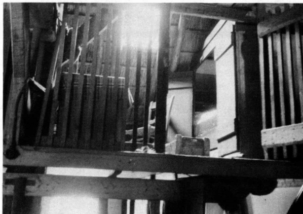
De boerderij van L.J. Linde en de slaappleats van zijn knecht in de schuur.