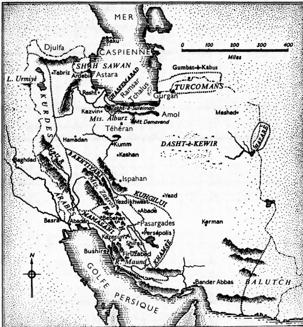
Carte de l'Iran indiquant approximativement les territoires où sont fixées les principales tribus de l'Iran.

zijn zelfs rondtrekkende agriculturisten. Niet alle pastorale nomaden zijn uitsluitend veehouders. Migraties kunnen plaatsvinden over grote afstanden of over kortere routes. De afstand waarover gemigreerd wordt en de tijdstippen waarop dat gebeurt worden bepaald door de mogelijkheden die dit terrein biedt. Dat terrein is niet door de nomaden gekozen, het wordt bepaald door de ruimte die de landbouwende bevolking niet meer kan benutten en aan de nomaden overlaat. Bijna altijd is het nomadenbestaan precair: plotselinge droogte, het risico van overbegrazing – niet gering, want de kudden vreten vaak het gras met wortels en al weg – en ziekten onder het vee kunnen tot hongersnood leiden. Roven wordt door anthropologen dan ook meestal bij de middelen van bestaan van de nomaden genoemd.