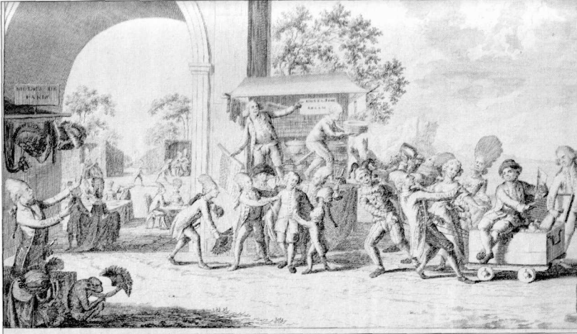
Een jonge Hollander versmaadt de producten van de Nederlandse nijverheid en geeft toe aan de verlokkingen van de 'Engelsche kraam' en de 'modes de Paris'.

manen en vrouwen, zich in de westerse cultuur hebben genesteld. De democratische revoluties zouden een belangrijke rol hebben gespeeld in de vestiging van het moderne sekseverschil. Het idee van politieke en burgerlijke gelijkheid zou zich hebben mogen doen gelden met betrekking tot stand en religie, maar uit het domein van sekse zijn geweerd. De voorstelling van sekseverschillen als absoluut, natuurlijk en onveranderlijk zou moeten worden begrepen als effect van het streven gelijkheid niet van toepassing te verklaren op de verhoudingen tussen mannen en vrouwen. 19 Dit zijn belangrijke inzichten, maar ik wil suggereren dat zowel sekse als politiek rond 1800 tegenstrijdiger waren dan hun geschiedschrijving wel eens doet vermoeden. Verwijfdheid is, als echo van eerdere vertogen over sekse en politiek, een categorie waarmee we uitstekend die tegenstrij-