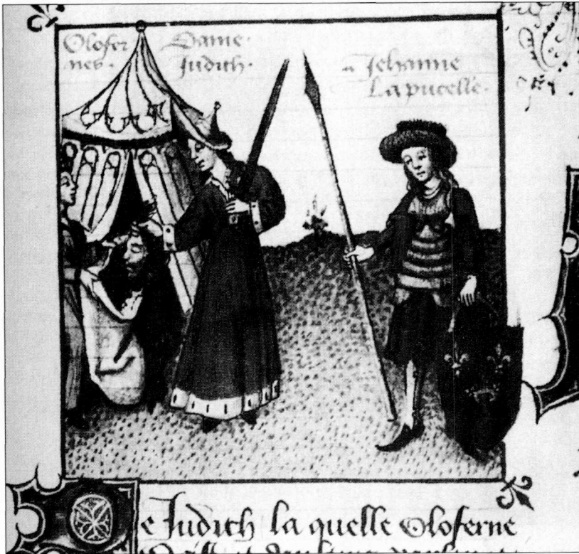
Jeanne d'Arc wordt vergeleken met een profetes uit het Oude Testament, Judith; afbeelding 15 e eeuw. Uit: Marina Warner, Joan of Arc (2000) afb. 22.

dertiende eeuw probeerden paus en kerkelijke overheden immers het alleenrecht op alle vormen van heilsbediening voor zich op te eisen. Alleen een priester mocht, vonden zij, de mis opdragen, de eucharistie bedienen, preken, biecht horen, dus Gods heil aan de mensen doorgeven. Dezulken werden daarvoor theologisch geschoold en ontvingen de priesterwijding, zij vormden een soort elitecorps. Vrouwen werden qualitate qua uitgesloten omdat de vrouwelijke sexe geen toegang had tot de theologiestudie en de priesterwijding, ook niet theologisch aangelegde vrouwen en leiderstypes. Met een beroep op de sociale inferioriteit van vrouwen werd gerechtvaardigd dat zij niet toegelaten konden worden. Hiertegenover begonnen nu gewone mannen en vrouwen, maar vooral vrouwen, zich te beroepen op het bijbelwoord dat Gods Geest waait waar Hij wil, zelfs, als Hij wil, naar sociaal inferieure wezens – Hildegard kwalificeerde zichzelf treffend als