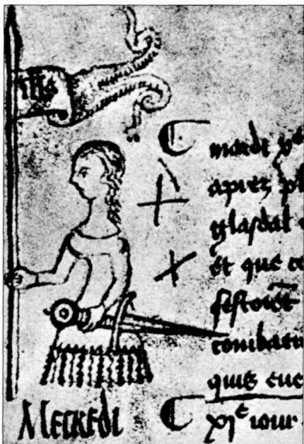
De oudste afbeelding van Jeanne d'Arc zoals geschetst door een klerk die noteerde dat Orléans was gevallen in 1429; afbeelding uit 1429. Uit: Marina Warner, Joan of Arc (2000) afb. 16.

dan als van dezelfde orde als de bijbelse kennis. 5 Een profetie kon ook verborgen kennis uit het heden openbaren, telepathische kennis over wat ver weg gebeurde of de geheime gedachten van een gesprekspartner. Het kon ook een toekomstvoorspelling betreffen.