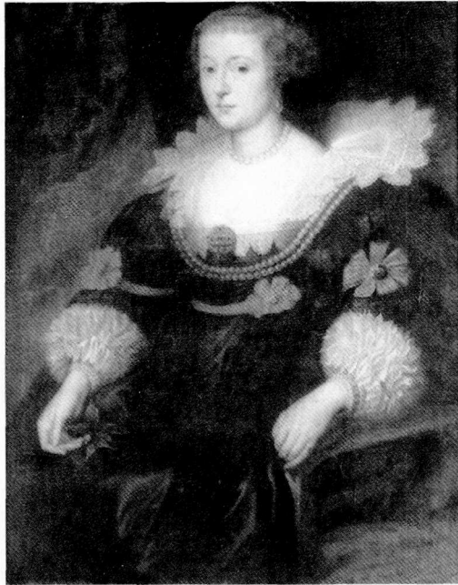
Amalia van Solms-Braunfels.

Tegelijkertijd deed de stadhouder zijn best het hart van zijn eventuele aanstaande voor zich te winnen, maar zijn pogingen Louise Henriëtte te veroveren, verliepen moeizaam. Hij sprak veel met haar op het hof, maar kreeg niet echt hoogte van haar gevoelens voor hem. Het dagboek leest op die momenten als een ingezonden brievenrubriek in een meisjesblad: 'Ick seide se genacht, doch sie wol mij niet aensien noch antwoorden, deed niet als lachen, weet niet wat dat