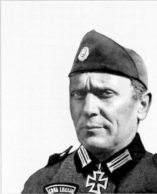
Maarschalk Tito in uniform van de fascistische militie Zwart Legioen.

fie, die zich liever concentreerde op de heroïsche rol van de partizanen in hun strijd tegen de Duitse en Italiaanse bezetters. Intellectuelen die aandacht vroegen voor 'Bleiburg' werd het leven zuur gemaakt, zoals de latere Kroatische regering dat deed met hen die aandacht vroegen voor de niet-Kroatische slachtoffers van Jasenovac. Onder hen bevonden zich nationalist, die de macabere gedachte propageerden dat het historische belang van Bleiburg dat van Jasenovac verre overtrof. Eind jaren tachtig barstte de discussie over de Tweede Wereldoorlog in alle hevigheid los. De Servische media