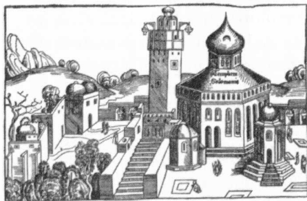
Afbeelding van de Templum Salomonis (1492). Uit: K. Laske en O. Holl ed., Lexicon der christlichen Ikonographie vol. 4 (Freiburg 1994).

Water en wassing als genezende kracht is in tegenstelling tot hogergenoemde vormen van cultus in het jodendom zeker niet archetypisch te noemen. In het Oude Testament wordt slechts één genezing door middel van water genoemd, de melaatse Syriër Naäman die zich zevenmaal in de Jordaan moet onderdompelen. 7