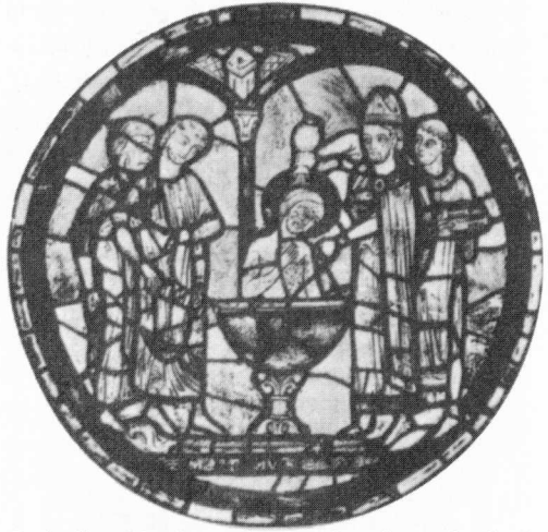
De heilige Martinus ontvangt het doopsel. Glas-inlood-raam uit de kathedraal van Chartres. Uit: K. Laske en O. Holl ed., Lexicon der christlichen Ikonographie vol. 4 (Freiburg 1994).

in de tweede eeuw na Christus getuigen bronnen van deze ontwikkeling in de Catholica. Twee teksten zijn -hoewel zij feitelijk uit de derde eeuw dateren- van belang, zij beschrijven immers een traditie die in oorsprong verder terug in de tijd ligt. Het gaat om de Traditio Apostolica , Zoals lang werd aangenomen van de hand van een Romeins priester Hippolytus 24 , en om het traktaat De Baptismo van de Noordafrikaanse theoloog