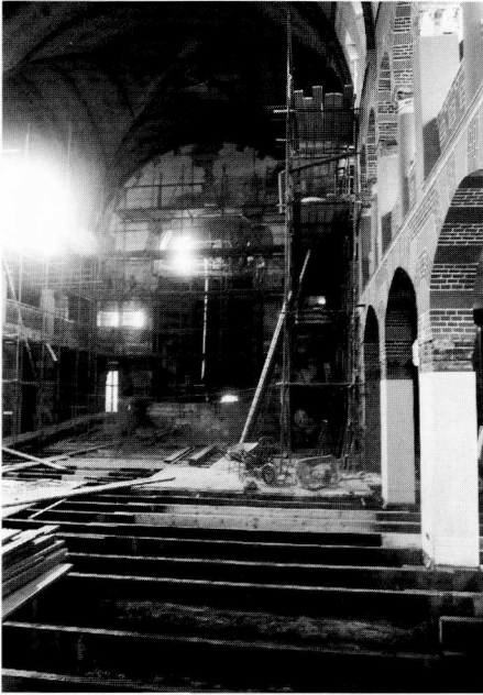
Werkzaamheden aan een vervallen sjoel.

Van het synagogegebouw zelf wordt slechts een deel als gebedsruimte gebruikt, de rest heeft een culturele bestemming gekregen, hetgeen een bijzondere combinatie mag heten. Naast diensten vinden er tentoonstellingen, concerten en lezingen plaats, veelal met een Joods of regionaal (De Ploeg) tintje.