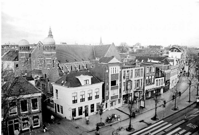
Synagoge gezien vanaf Zuiderdiep.