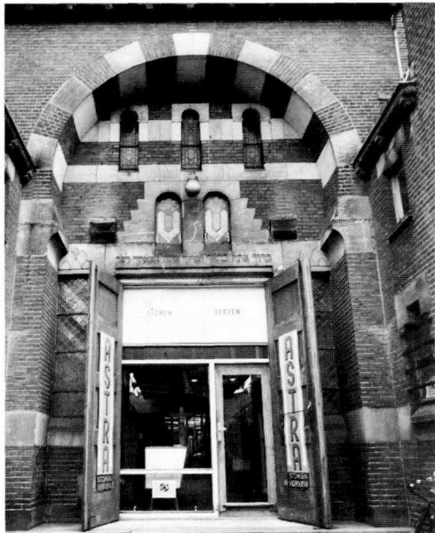
Ingang Astra onder de Hebreeuwse tekst 'Gezegend bent u bij uw ingaan en gezegend bent u bij uw uitgaan'.

en een maand later (20 december) werd het daadwerkelijk voor 100.000 gulden aan de Chemische was- en ververij Astra verkocht. Het betekende het begin van grootschalige verbouwingen. Zo werden de bovengalerijen dichtgemetseld en kwam in het oostelijk dwarsschip een provisorisch plafond. Door deze laatste ingreep ontstond een afgesloten ruimte die diende als kerkruimte voor zo'n 350 kerkgangers. De eigenaar van de stomerij was namelijk tevens voorzitter van het Apostolisch Genootschap. Op 19 november 1952 werd het genootschap tevens officieel