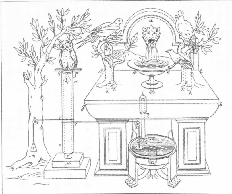
Automaton van Hero. Door het lopende water draait de uil weg, op dat moment gaan de vogels zingen, wanneer de uil weer naar hen terugdraait, zwijgen zij weer (bron: John W. Humphrey ed., Greek and roman technology: a sourcebook (Londen 1998) 64-65).

des de wiskunde naar een hoger plan en ontwikkelden Kallimachos en Theokritos nieuwe literaire vormen. In het Alexandrië van de derde eeuw was het de artsen Herophilos en Erasistratos toegestaan om systematisch sectie te verrichten op (dode) menselijke lichamen, om zo het ader- en zenuwstelsel in kaart te brengen – een vorm van medisch onderzoek die voorheen taboe was en nadien opnieuw taboe werd. Onder bescherming van de Ptolemaeën waagde de filosoof Euhemeros het om openlijk aan de goden te twijfelen – een euveldeed waarvoor je in het Klassieke Athene in het beste geval de stad uit werd gejaagd. 19 Een dergelijk streven naar innovatie, een dermate grote tolerantie voor nieuwe, zelfs subversieve ideeën vinden we pas weer in de Renaissance. Toevallig is dat niet: ook in het Renaissancistische Italië was vorstelijk mecenaat de motor die de wetenschappelijke en artistieke vooruitgang deed draaien – Galileo