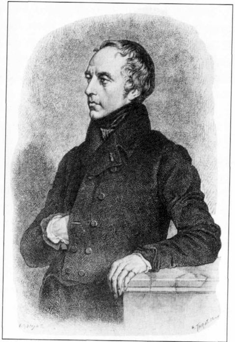
De Franse staatsman Guizot (1787-1874).

zo'n frivole katholieke dame, die bovendien ook nog vijftien jaar ouder was dan hij, kon ze nu met tevredenheid constateren dat met het huwelijk en het hoogleraarsambt Guizots laatste wilde haren waren verwaaid. Hij was toen vijftwintig jaar oud, klein van stuk, mager en zelfs enigszins bleek van teint, maar wel gezegend met edele en regelmatige gelaatstreken die hem een zelfbewust voorkomen gaven. Zijn stem had bovendien een timbre waarmee hij iedereen in zijn greep hield. Zoals een bevriende collega, Charles de Rémusat, hem eens typeerde zie je hem zo voorbijgaan: 'Il a l'air d'une idée qui marche!' 3