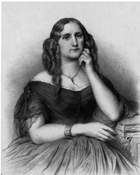
Delphine de Girardin

Delphine de Girardin (1986, I, p. 639-640) beschreef in haar column in 1840 de salon als een theater met de gastvrouw als de steractrice die van toneelspel hield en allerlei rollen op zich nam. De gastvrouwen regelden quasi-spontane ontmoetingen tussen politici in hun salons en speelden de