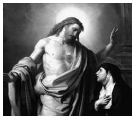
Versijning van Jezus aan Margareta- Maria Alacoque