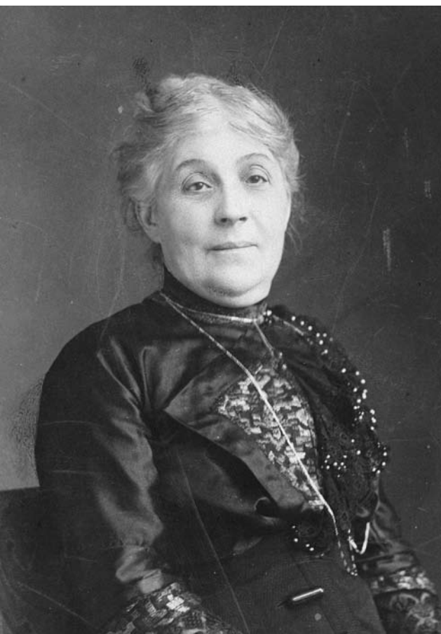
Portret Wilhelmina Drucker

hun eigen levenspraktijk de grenzen ervan verkenden en opreken. Door alleen of ongehuwd samen te wonen en met werk in het eigen levensonderhoud te voorzien. Door alleen te reizen en in het openbaar te spreken en te schrijven over onderwerpen die voorheen als ongepast waren beschouwd voor vrouwen uit die geledingen in de maatschappij waar 'reputatie' zwaar woog (Van Calcar, 1884, noot p. 167; Everard, 2007).