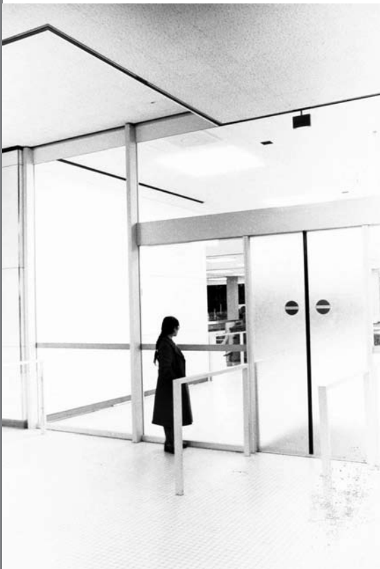
Foto: Bertien van Manen, Vrouwen te gast (1979), Feministische Uitgeverij Sara

Er zijn echter duidelijk punten waarop de Surinaamse en Antilliaanse vrouwen afwijken van de Turkse en Marokkaanse. Eén daarvan betreft hun 'maatschappelijke positie' bijvoorbeeld als werkloze, huisvrouw, gepensioneerde of scholier. Het aandeel huisvrouwen is bij de Surinaamse en Antilliaanse vrouwen het laagst van de vijf groepen (een derde). Ongeveer de helft van de Surinaamse en An-