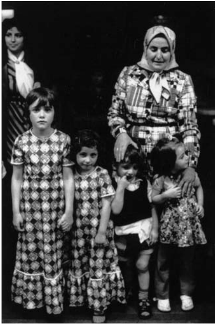
Foto: Bertien van Manen, Vrouwen te gast (1979), Feministische Uitgeverij Sara

Nederlandse migrantengroepen die ook in grote getale in andere westerse landen voorkomen, zoals de Turken en de Marokkanen.