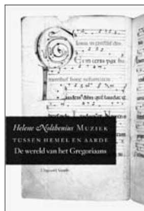
Boekomslag Muziek tussen hemel en aarde

Het is echter niet moeilijk om aan de hand van Mulders eigen methoden dit impliciete