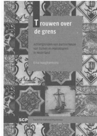
Den Haag: Sociaal Cultureel Planbureau, 2003, 288 pp., € 24,-