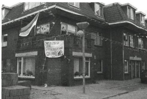
Foto 2 'Samen zijn we sterk, Wippolder voor Oranje', spandoek in de 'Oranjestraat', Wippolder, Delft

Over de oranjegekte is in kranten zowel in positieve als in negatieve, soms denigrerende bewoordingen geschreven. Zo zegt Vossestein (verbonden aan het Koninklijk Instituut voor de Tropen) in een interview: 'De oranjegekte is niet meer dan een fuifje voor verwende kinderen. (...) We zijn zeer welvarend en uiterst tevreden. In een land zonder zorgen is het leuk om af en toe uit de band te springen.' 3 Ook de historicus Von der Dunk schaart zich met zijn artikel 'Oranjegevoel heeft infantiele trekken' bij de sceptici. 4 De uitbundigheid wordt door een aantal door de Volkskrant geïnterviewde buitenlanders in Nederland juist erg gewaardeerd: 'Nederland ondergaat een metamorfose. Wat dat betreft zou het altijd Euro 2000 moeten zijn: de Nederlanders tonen zich nu een stuk minder bars'; 'Gek doen is gezond. En trots zijn op je land natuurlijk'; 'Ik vind het geweldig, al dat oranje. Iedereen is gelijk, alle verschillen zijn weggevaagd'. 5