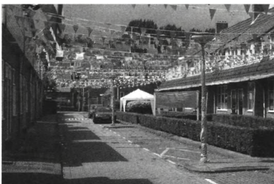
Foto 8 'Oranjestraat' met partytent en scorebord, tuindorp Vreewijk

De spontane versierfeesten op initiatief van bewoners, kenmerken zich soms door rituelen die verder gaan dan het versieren an sich . Daarbij hoort het gezamenlijk televisie kijken, op straat, en het actief volgen van de verrichtingen van het Nederlands elftal. Bevorderlijk voor sociale contacten zijn ook de voetbaltoto's, doordat mensen elkaar aanspreken op het al dan niet uitkomen van hun voorspellingen. De straat wordt uitgerust met een provisorisch scorebord waarop uitslagen worden bijgehouden en op de avonden waarop wedstrijden gespeeld worden, wordt een televisietoestel buiten gezet, eventueel tegen regen beschermd door middel van een partytent of opblaasbare dug-out (foto 8).