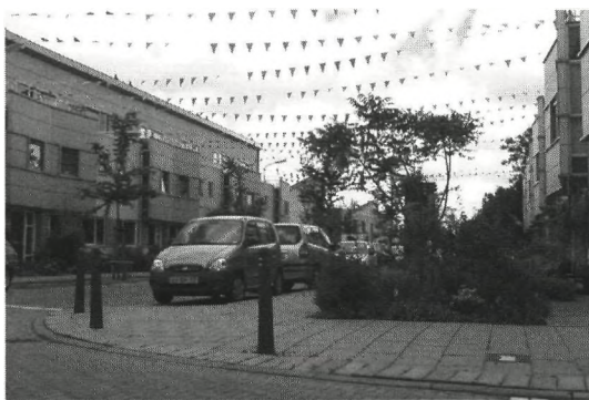
Foto 7 Dure nieuwbouwstraat, Vinex, Delfgauw

Delftse wijken waarin beslist geen volksbuurten liggen en waar we toch versieringen aantreffen, zijn Tanthof-West en Voordijkshoorn, twee aanzienlijk duurere buurten. In het laatste geval is sprake van nieuwe eengezinskoopwoningen, die, waar de versierselen zijn aangegeven, aan knusse, identieke dwarsstraatjes liggen. In Tanthof-West staan prijzige eengezinshuizen uit het midden van de jaren tachtig, aan de rand van de gemeente. Een derde markante afwijking van het ‘volksbuurtbeeld’ troffen we op de Vinex-nieuwbouw in het aangrenzende Delfgauw, waar vrijwel geen versieringen hingen, met uitzondering van één brede, dure en overtuigend behangen straat (foto 7). In deze straten gelden kooprijzen van meer dan een half miljoen (anno 2001).