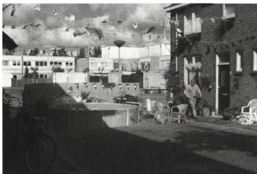
Foto 6 Zwembad aan het eind van de Biltonstraat, afgeschermd door rieten mat, Vrijeban

noordwestkant van de wijk Hof van Delft, met portiek- en eengezinswoningen, bij het beeld van de volksbuurt.