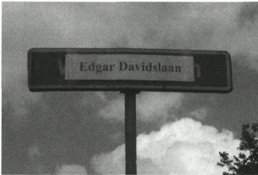
Foto 4 Edgar Davidslaan, voorheen Wilgenlaan, Bomenwijk, Vrijeban