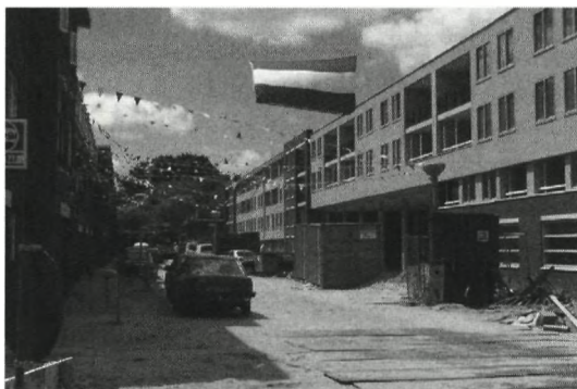
Foto 5 Links oude woningen, rechts nieuwbouw, Wippolder

voor- en tegenstanders van versieringen. Ook vertelde een bewoner over versieringen die voor zijn bovenraam werden aangebracht, zonder dat hij hierin gekend was. De sfeer in de straat is uitbundig, maar ook wat gespannen, alsof je beslist niet hardop kunt zeggen dat je hoopt dat Frankrijk het toernooi wint.