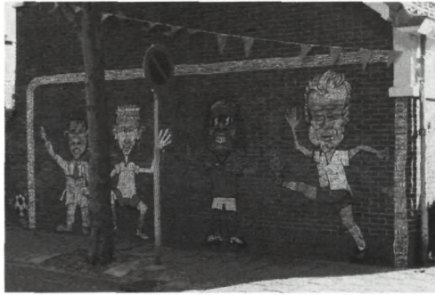
Foto 1 Muurschildering, omgeving Brasserskade, Vrijeban, Delft

bolletjes aan de autoantenne, tot opblaasbare klompen op het hoofd, een dug-out , oranje condooms en de zogenaamde BalBQ. De kranten besteedden veel aandacht aan het fantasieloze en overdadige van de commercie 1 , een overdaad die zich de laatste jaren meer dan voordien richt op consumptie rond het huis: dug-out en BalBQ vragen om een plaats in de tuin, de straat of op het plein. De commercie lijkt in te haken op de trend om niet louter het eigen lichaam tot uithangbord van loyaliteit aan oranje te maken en te laten prijken op tribunes en openbare ontmoetingsplaatsen, maar om huis en straat voor een voetbaltoernooi te versieren en ook met de straat het voetbaltoernooi te 'beleven'.