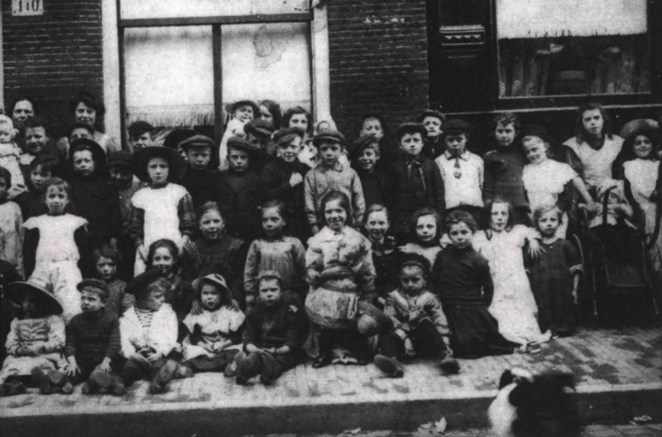
Grote Kattenburgerstraat Amsterdam, 1914.