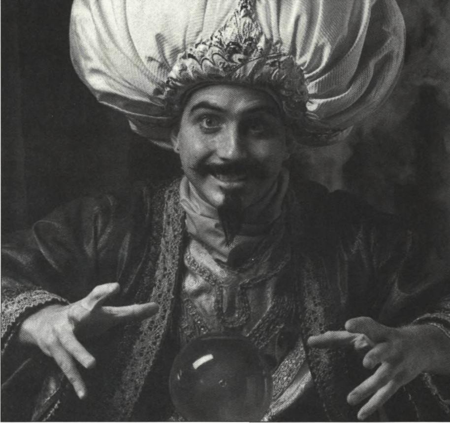
Advertenties in Science .

Enige speculaties en reflecties over magie, wetenschap en glas